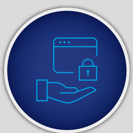
Lösungsdesign und Bereitstellung