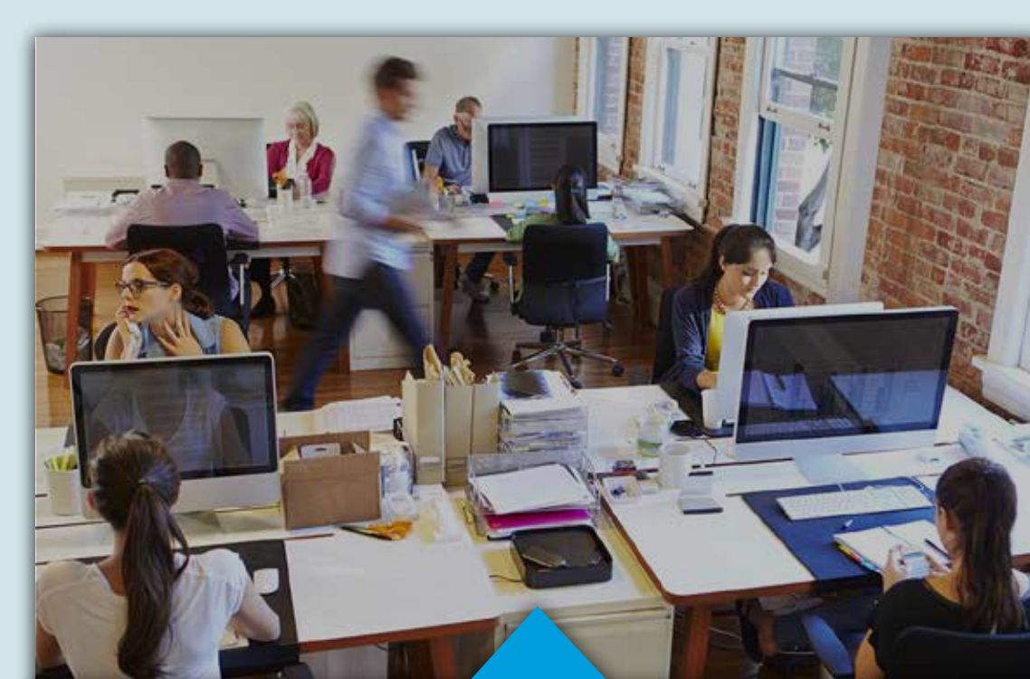
IHRER DIGITALEN ARBEITSPLÄTZE