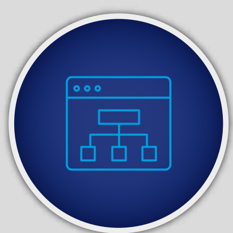
Konsolidierung und Lizenzverwertung

Computacenter unterstützt Sie mit einem breiten Spektrum an Dienstleistungen dabei, Ihre Investitionen in Microsoft Security zu optimieren. Dazu gehören: