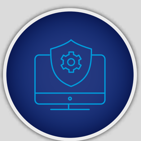
Managed Microsoft Security